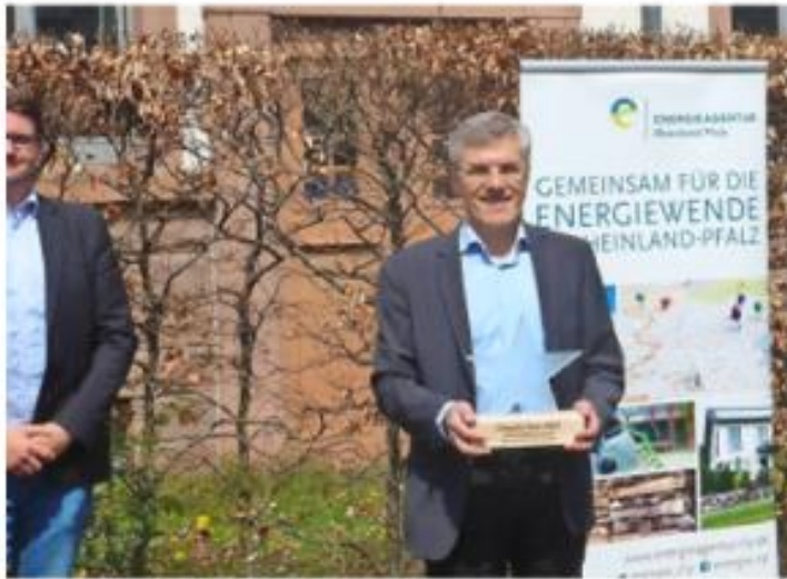
Projekt KlikK gewinnt den Climate Star

6. Mai 2021 um 08:33 Uhr | Lokalnachricht | Eine Stunde